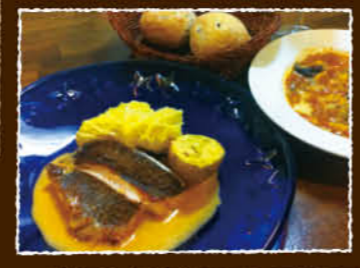
レストランラパン Map A-3 03-3993-8765 練馬区練馬1-29-16 営業: 11:30-14:30 18:00-24:00 水曜休