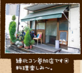
練馬区コン参加店です*料理室あり!

ランチセットは1200円で、パン・前菜・メイン・デザート・コーヒーのフルコース! 季節によって面白いものが食べられます。去年の12月はラム肉のステーキやソーセージがランチセットに登場! 今年も要チェックポッコリ!