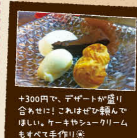
+300円で、デザートが盛り合わせに! これほげひんぽんほし。ケーキやシュークリームもすべて手作り!

フレンチのシェフが主役のドラマがあったポッコリね。あんな感じで、若くて素敵なオーナーシェフが、汁かけと料理を出してくれるポッコリ。ランチセットは、前日のディナー用食材を使ってるから、「この値段で、え〜?!」ってくらいおいしいものが出てくるポッコリ。