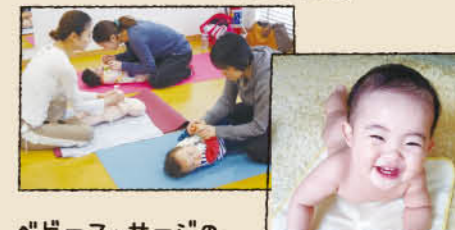
ベビーマッサージのデモンストレーションを行いました。ヨガマットの上にタオルを敷いて、オイルを使い赤ちゃんをマッサージ!

ピラティスもスタート! 難しそう…、辛そう…というイメージがあるかもしれませんが、asaka先生の分かりやすい説明で、身体の筋肉の使い方があかまて面白く! 骨盤やお腹周りの筋肉をつけるから、これも産後に交か〜。