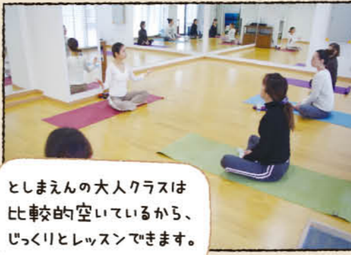
としえんの大人クラスは比較的空いているから、じっくりとレッスンできます。

1000円で本格ヨガ「ネリヨガクラブ」の豊島園スタジオの紹介です。としえん教室は、昨年11月からスタートしました。としえん馬5分。庭の湯の向いの新しいスタジオで行っています。