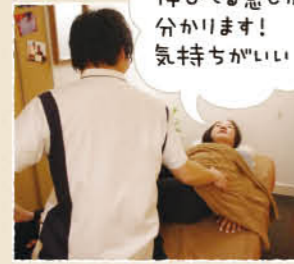
伸びる感じが分かります! 気持ちがいい