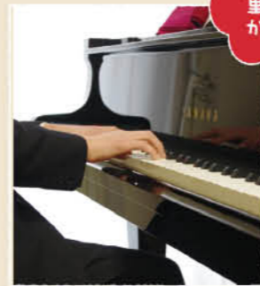
ちょっと音をずらしたり重ねたりするのがカッコいい!

クラシックとポップスの譜面を見比べてみると分かります。クラシックは譜面が2段になっていて複雑だけど、ポップスは譜面が一段。そして譜面の上に書いてあるBとかCとか書いてある。これがコードというもの。