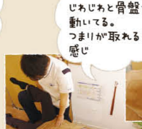
じわじわと骨盤が動いている。つまり取り除ける感じ