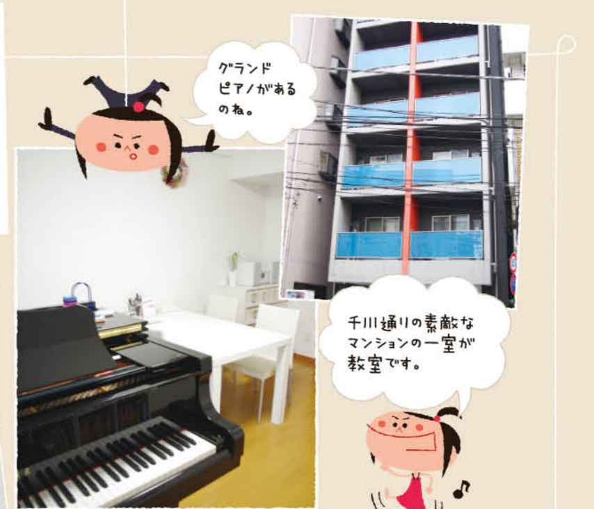
ランドピアノがあるのね。

ポピュラーコース月2回45分 通常9000円 → 7500円 ※詳しくはHPまたはお電話で!