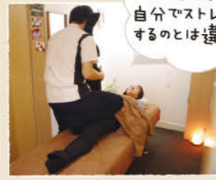
これは気持ちいい。自分でストレッチするとは違う