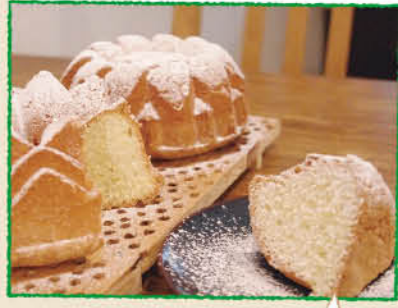
小麦粉と奄美大島のきび砂糖で作ったケーキ/350円