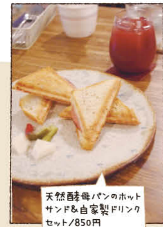
天然酵母パンのホットサンド&自家製ドリンクセット/850円