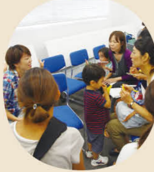
参加してくれた幼稚園ママは13人。皆さん、私の想いに共感し、ボランティアで時間を作ってくれました。

第1回目は5月に実施、今回は2回目になります。定員30組に申し込め、50組以上の申し込みが殺到し、ママ達の興味深さを改めて感じました。特に驚いたのは、来園入園ではないお子さんを持つママが半分くらいいたこと。今は、保育園だけでなく、幼稚園に入るのも難しい時代。ママ達も不安なようです。